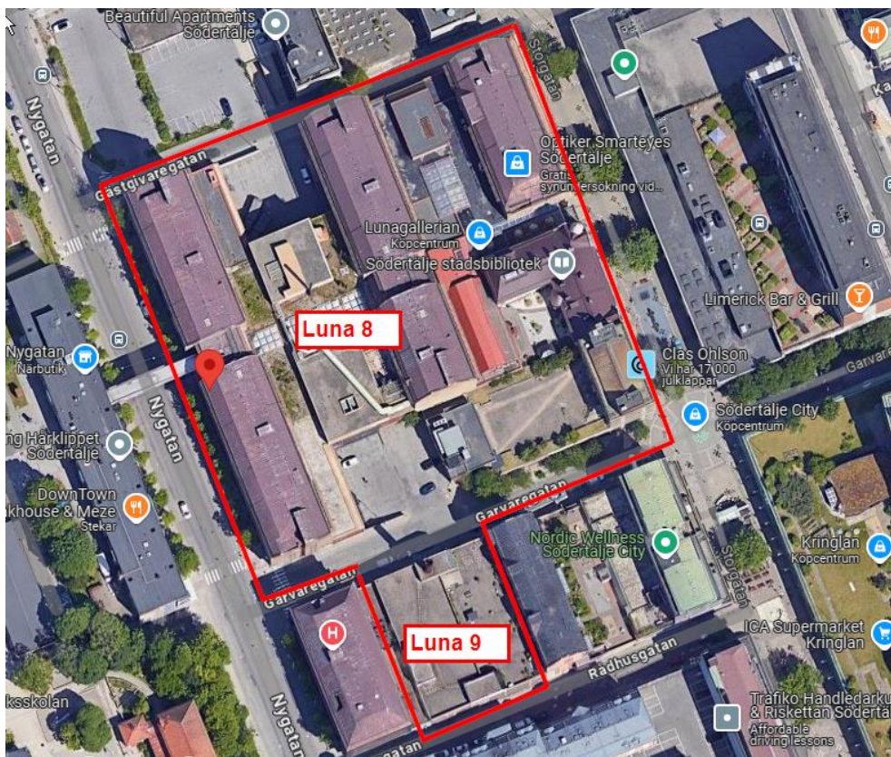
Bilaga 1 – Bild över tilltänkt område.

Luna 9 som är ett parkeringshus i dagsläget kommer att rivas och endast garaget med tillhörande våningar i källaren kommer att bevaras, på denna tillkommer två (2) nya huskroppar, ca 3 våningar höga av KL-trä & Limträ. Se bilaga 1 nedan över berört område.